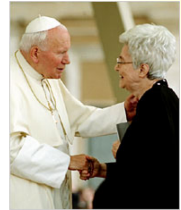
Chiara Lubich (1920-2008)

Steigėja Chiara Lubich ypatingai pasitikėjo jaunimu, pabrėždavo, kad jis siekia aukščiausių tikslų ir ieško didelių idealų. Mes, Fokoliarų judėjimo jaunimas, esame iš įvairių šalių, socialinių sluoksnių ir religijų išipareigoję radikaliai gyventi vienybės dvasingumu. Susijungę pasaulyje į vieną tinklą, mes susitinkame mažose grupėse,